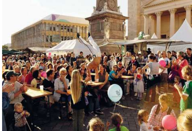
Das war im Herbst 2012: Die abl-Delegation zu Besuch am Potsdamer Genossenschaftstag.

andere sind, liegen heute in Potsdam wie in Luzern die gleichen Fragestellungen auf dem Tisch; unter anderem wie wir in Zukunft bezahlbaren Wohnraum anbieten können.