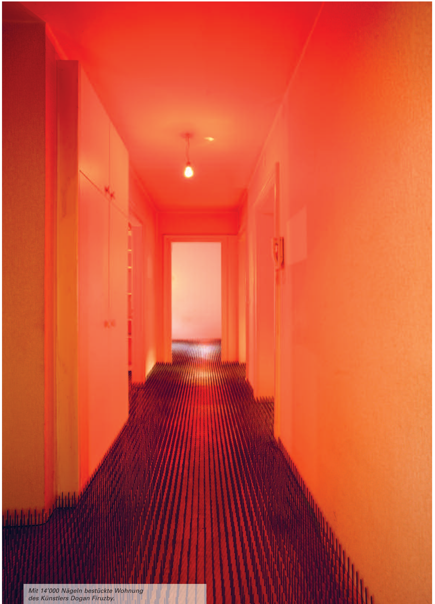
Mit 14'000 Nägeln bestückte Wohnung des Künstlers Dogan Firuzby.