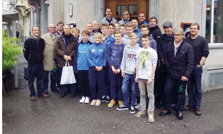
Potsdamer Treffen in Luzern zwischen Sportjugend und Genossenschaften.

«Vier Tage in Luzern, Tage voller Eindrücke, sie waren geprägt durch neue Bekanntschaften, herrliche Stadtimpressionen, gutes Essen und interessante Wohnbauprojekte. Die Wohnungsgenossenschaften Luzerns haben ganz ähnliche Aufgaben zu lösen wie wir in Potsdam. So haben die Luzerner Einwohner per Volksentscheid entschieden, dass der Anteil an genossenschaftlichen Wohnungen erhöht werden soll. Diesem Votum fühlen sich die Genossenschaften und die Stadt verpflichtet. Wir haben gesehen, wie Projekte umgesetzt wurden und neue geplant werden. Welche Wege dabei gegangen werden, ist auch für uns Potsdamer von grossem Interesse. Luzern und Potsdam stehen vor dem gleichen Problem, dass mehr bezahlbare und gute Wohnungen gebraucht werden. Die genossenschaftliche Partnerschaft sollte unbedingt fortgeführt werden, sie hat für beide Seiten Vorteile.»