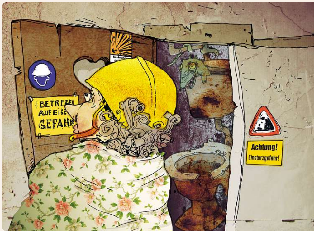
Sandra Baumeler, Illustrationen Tino Küng