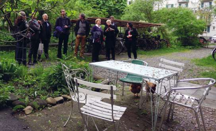
Idylle mit Hühnern im Rhynauerhof.