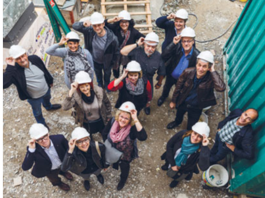
Gut behelmt und frohen Mutes: Die Gäste aus Deutschland mit den abl-Verantwortlichen unterwegs.

Marlise Egger Andermatt