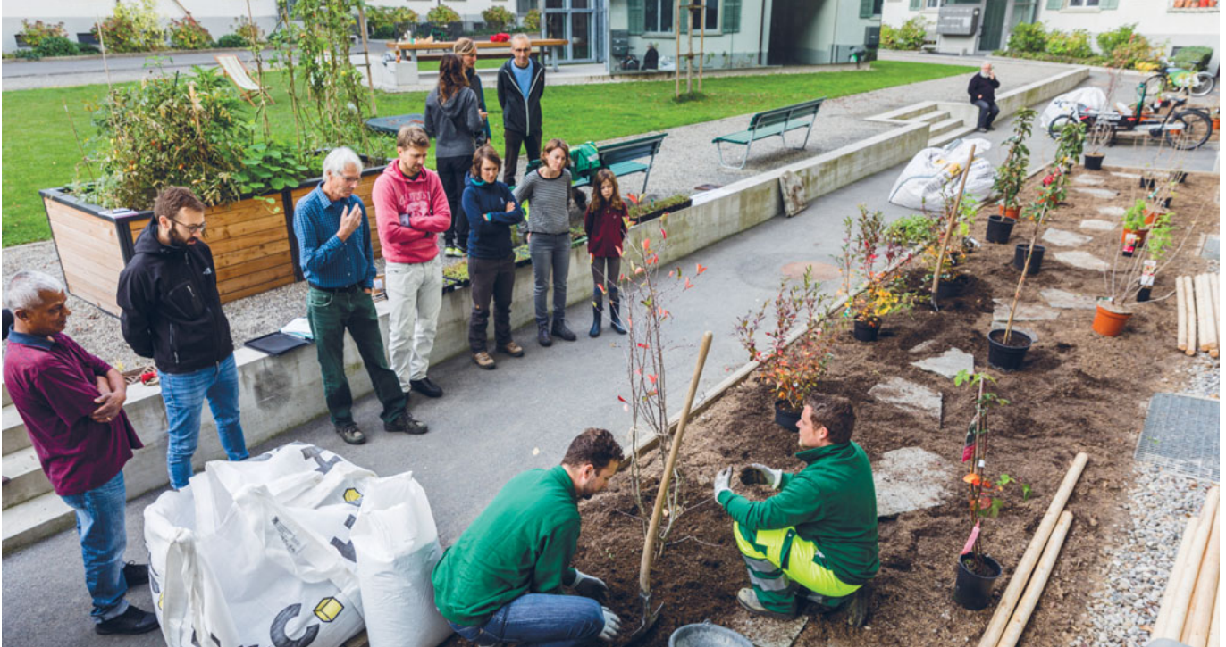
Mitarbeiter der Stadtgärtnerei erklären, wie richtig gepflanzt wird.

Judith Bachmann Hodel