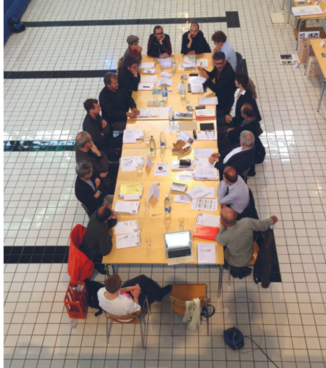
Das Preisgericht und die Experten liessen sich im Neubad-Pool inspirieren.

Im Projektwettbewerb für die Entwicklung des Industriestrasse-Areals in Luzern sind 13 Architekturbüros für die zweite Stufe ausgewählt worden. Sämtliche Präsentationen waren am 2. Oktober im Neubad über die Bühne gegangen.