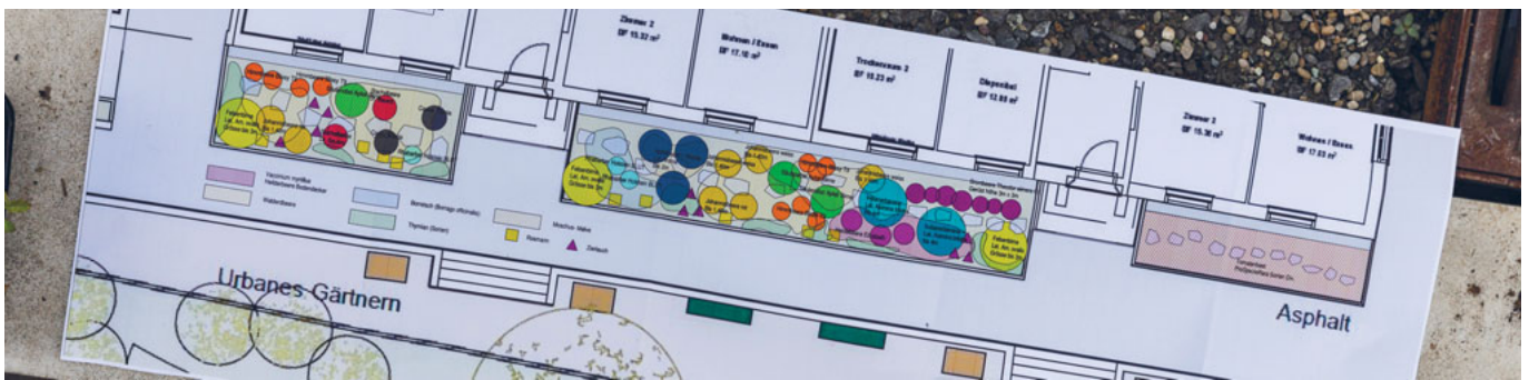
Hübsche Holzschilder informieren über das «Was» und «Wann ernten» (oben). Alleine schon der Pflanzplan ist bunt und macht Freude.

er kann auf die Mithilfe der Gartengruppe zählen. «Da kommt abwechslungsreiche Gartenarbeit auf uns zu. Ich freue mich darauf. Dass ich zusätzliche Helfer benötige, ist klar. Ich bin zuversichtlich, dass sich Freiwillige aus den Reihen der 130 Mietparteien melden», sagt er und setzt eine Johannisbeerstaude in das vorbereitete Erdloch, bevor er sich eine kurze Pause gönnt.