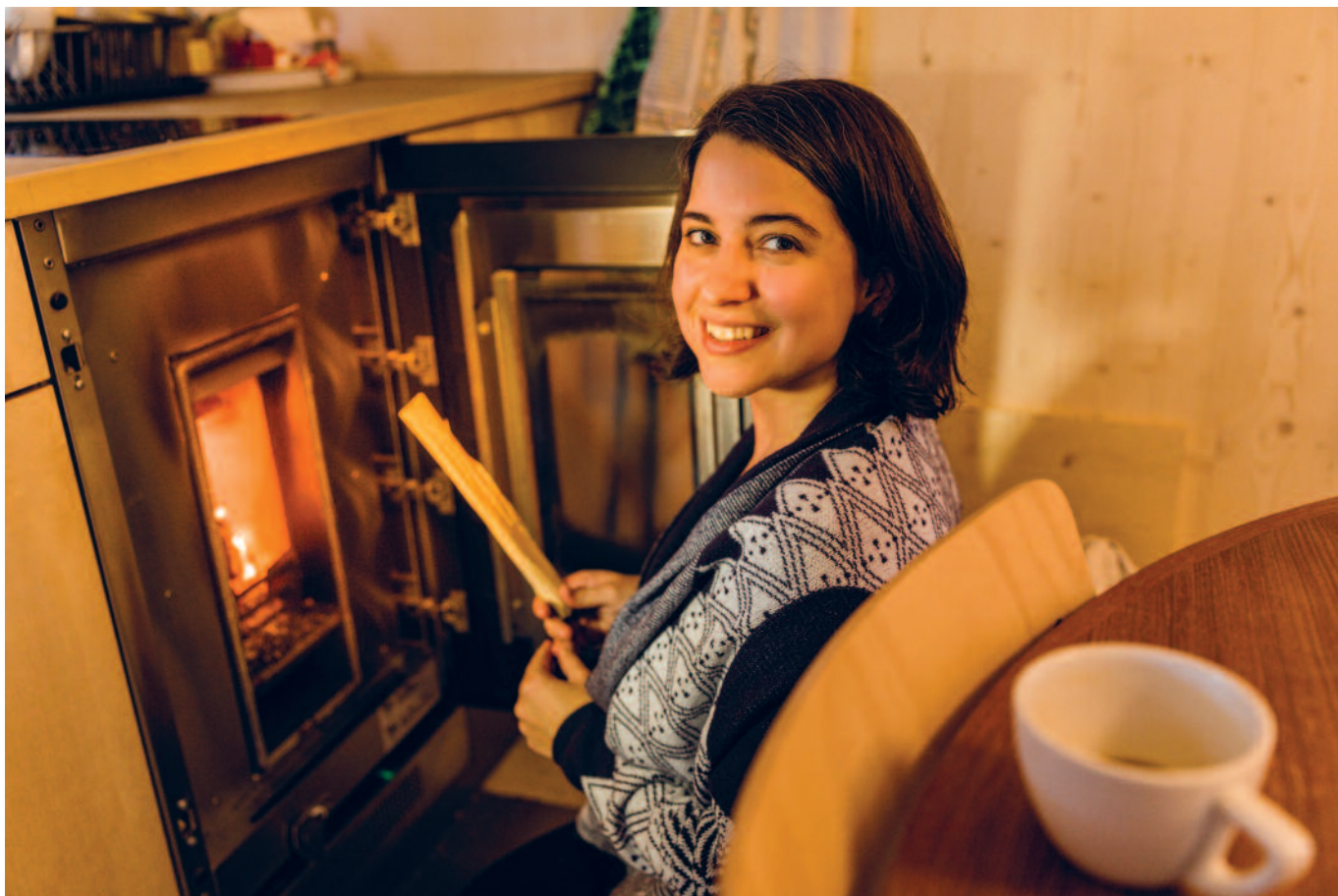
Das Feuer im Holzpavillon ist entfacht: Herzlich willkommen, Nachbarschaft!