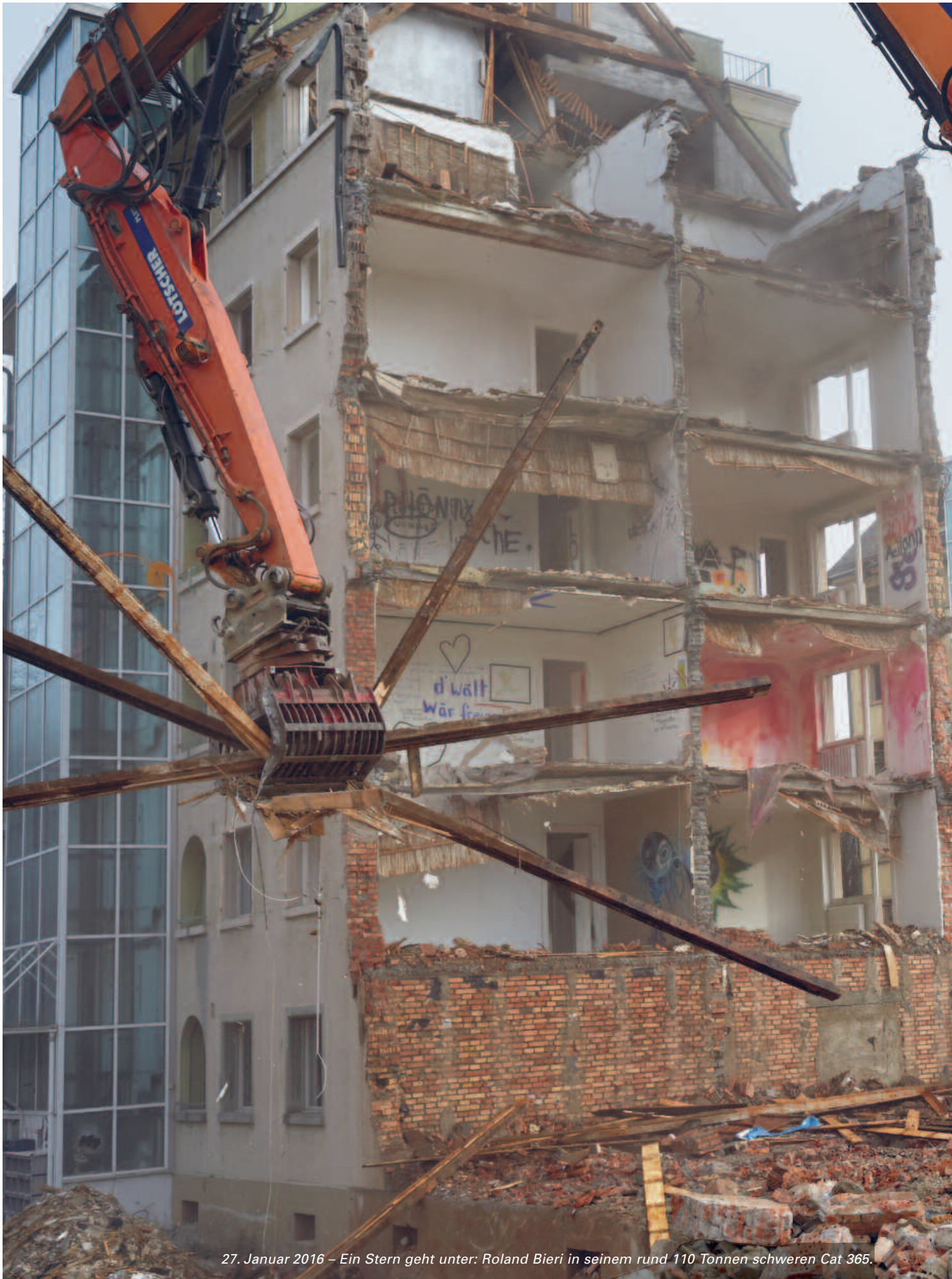
27. Januar 2016 – Ein Stern geht unter: Roland Bieri in seinem rund 110 Tonnen schweren Cat 365.