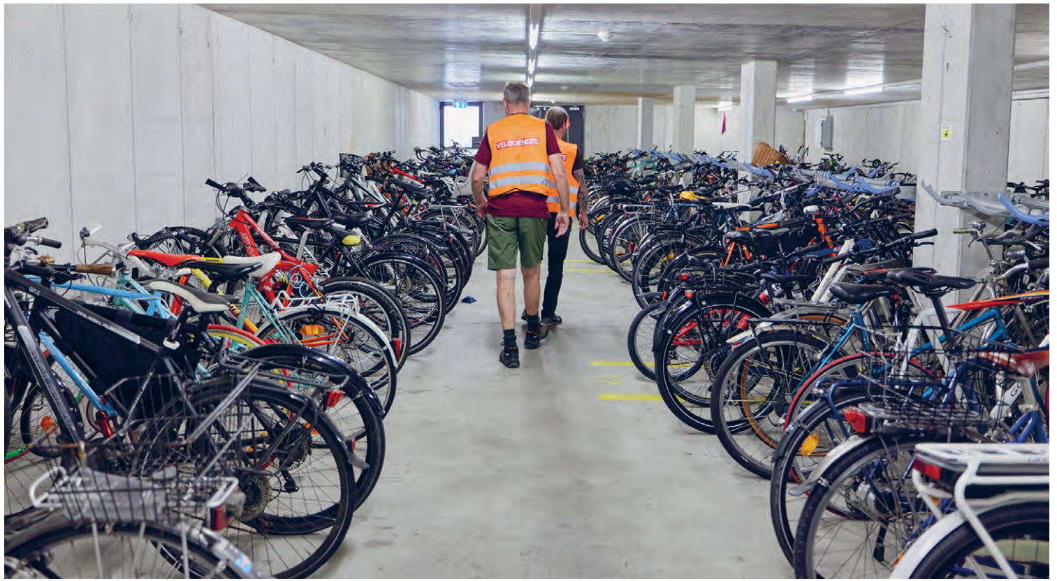
Das Team der Caritas kämpft sich durch den Velo-Dschungel.