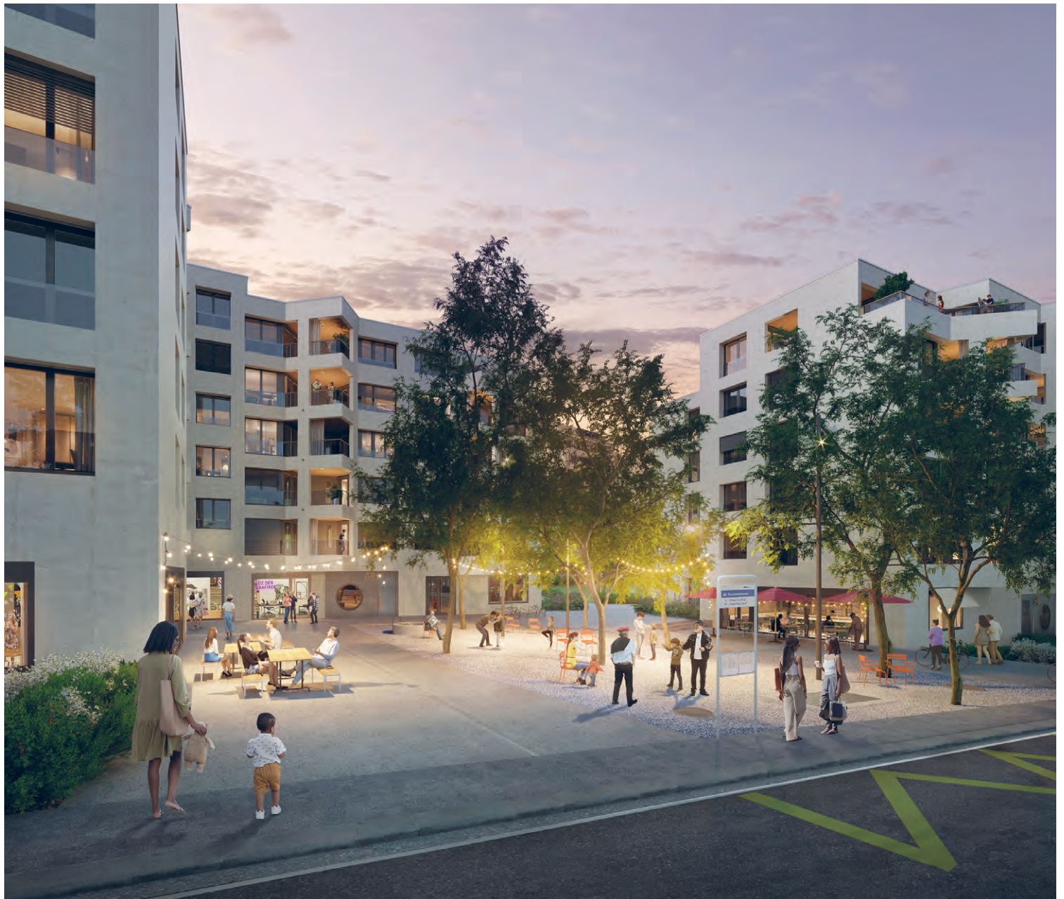
Ankommen in der oberen Bernstrasse: Auf dem Quartierplatz trifft man sich gerne.