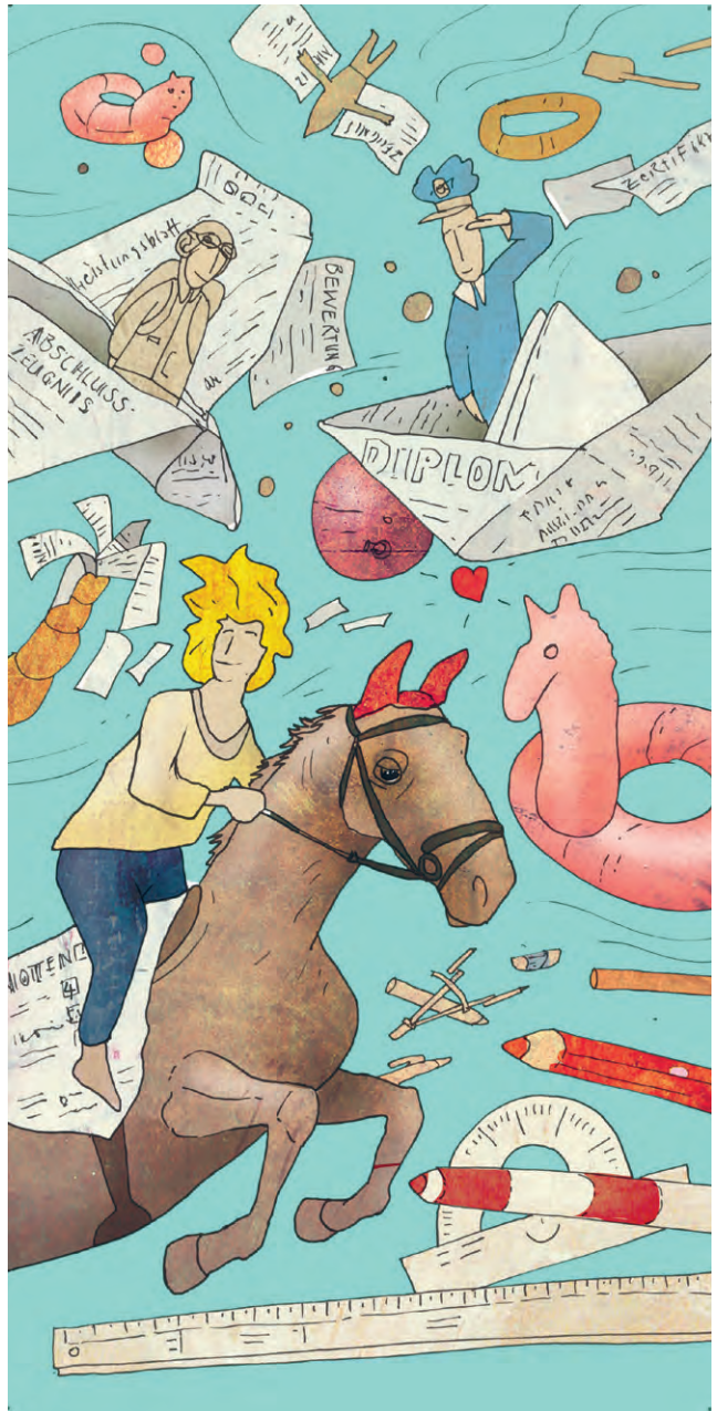
Finde die acht Unterschiede zwischen den beiden Bildern... Illustration Tino Küng