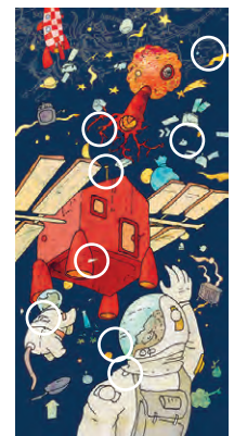
Auflösung zum letzten magazin: die acht Unterschiede vor einem Monat