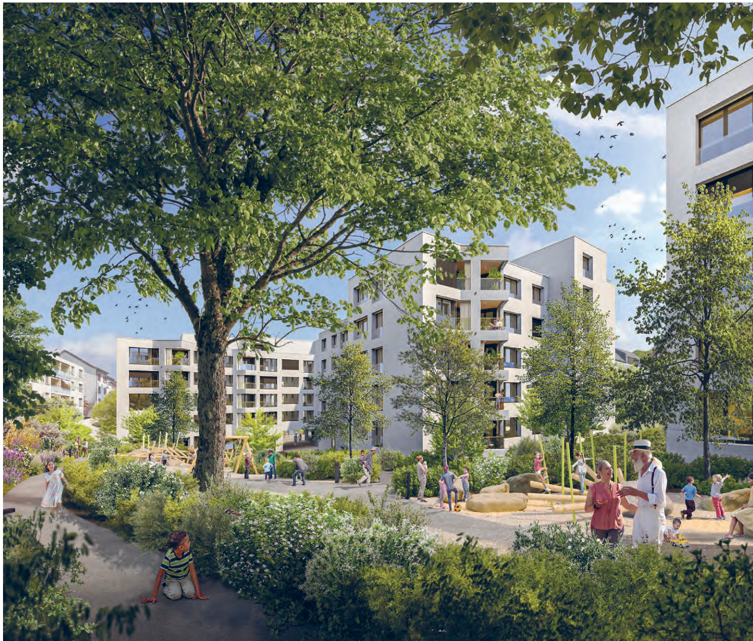
Ein kleines grünes Paradies mit viel Platz zum Spielen, Schwatzen und Verweilen.

lichkeiten für die Kinder sind umrahmt von heimischen Pflanzen, Stauden und Laubbäumen. Sitzgelegenheiten laden immer wieder dazu ein, die Seele baumeln zu lassen. Die Wege sind auch mit kleinen Rädern (Rollatoren, Laufräder oder Kinderwagen) gut befahrbar und verbinden die einzelnen Häuser miteinander. Und von der Stollberghalde führt ein offizieller Wanderweg durch die grüne Idylle an der Bernstrasse!