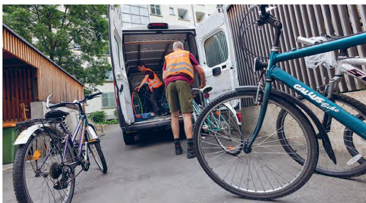
Alle Fahrräder ohne Markierung (links oben) dürfen bleiben. Der Rest wird verladen und in die Velohalle beim Bahnhof gebracht.

sammlungen für die Caritas koordiniert, bezeichnet die effektive Rückholquote als sehr tief. «Es ist aber wichtig, dass wir den Prozess immer gleich durchspielen und der Eigentümerschaft diese Gelegenheit geben. Danach geht der Besitz der Velos an die Caritas über.»