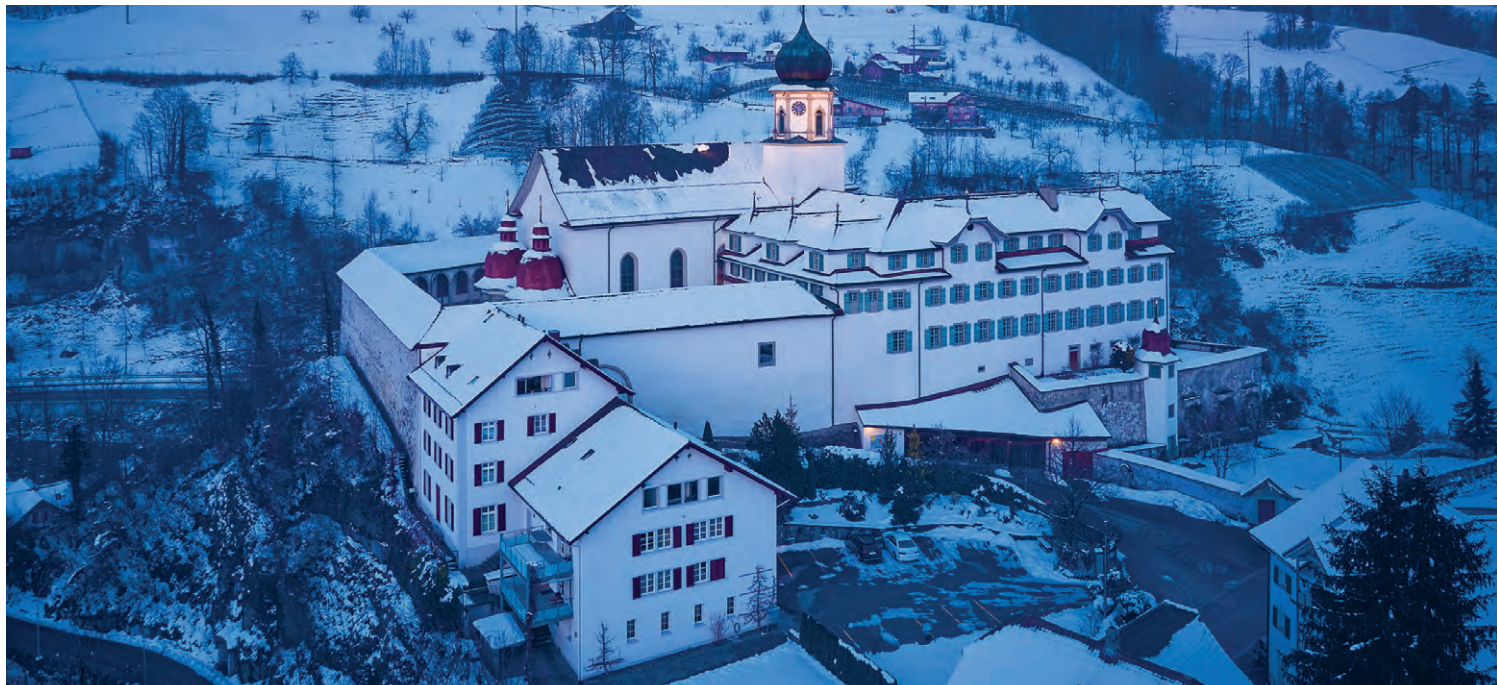
Im Dezember gehts mit Hansruedi der Emme entlang am Kloster Werthenstein vorbei.