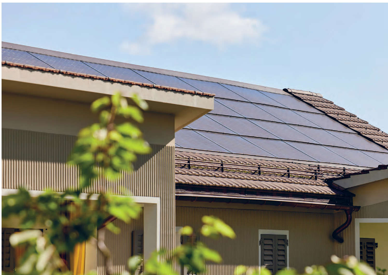
Effiziente PV-Module können heute auch auf Dächern installiert werden, die nach Osten, Westen oder gar Norden ausgerichtet sind.