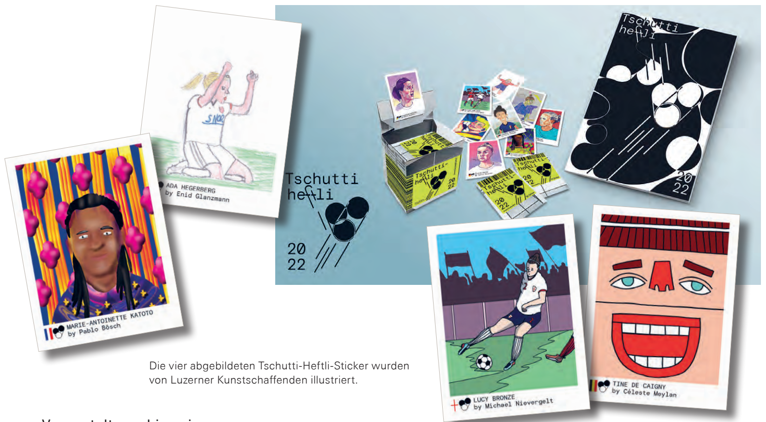
Die vier abgebildeten Tschutti-Heftli-Sticker wurden von Luzerner Kunstschaffenden illustriert.