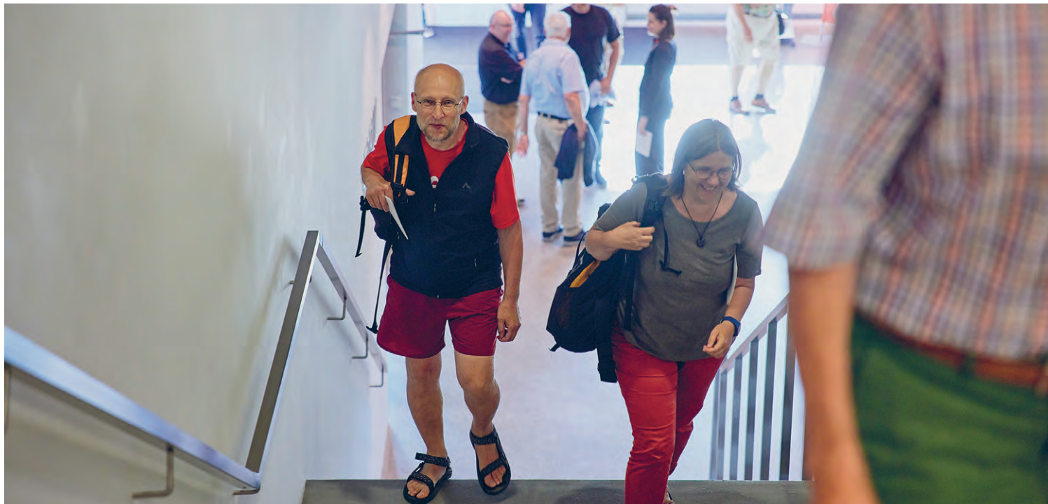
Eintrudeln auf der Messe Allmend anlässlich der Infoveranstaltung über die 98. abl-Generalversammlung.